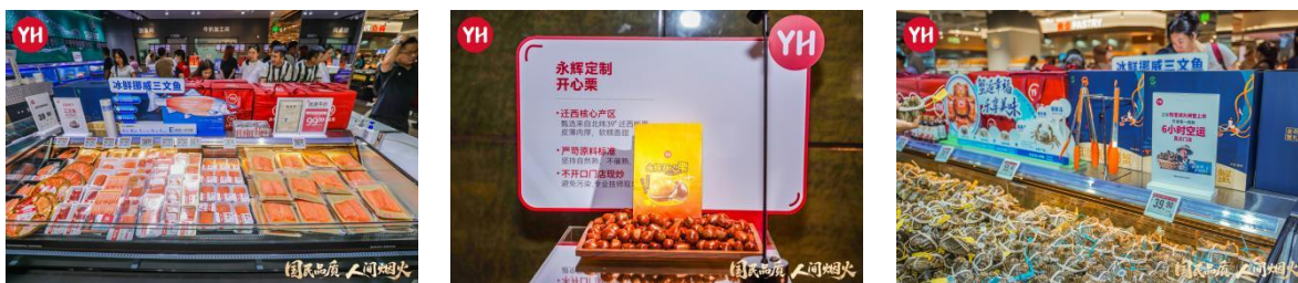
(注：上图为公司 2025 年第三季度推出的部分品质单品)